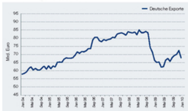
Deutsche Exporte seit 2004