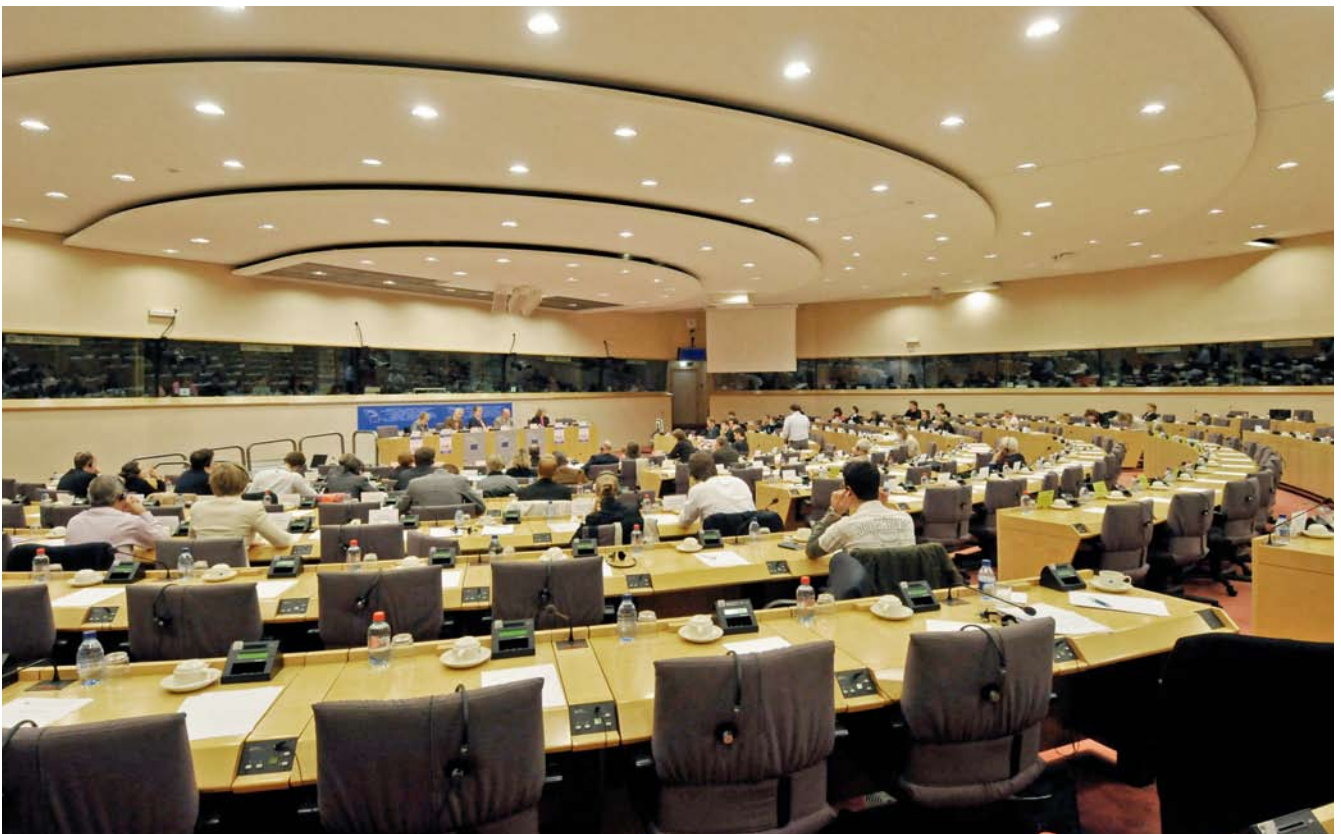
Die Ausschüsse bereiten mit ihrer inhaltlichen Arbeit die Entscheidungen des Europäischen Parlaments vor.

Eine Übersicht über wichtige Ansprechpartner in den wirtschaftsrelevanten Ausschüssen des Europäischen Parlaments findet sich im Anhang.