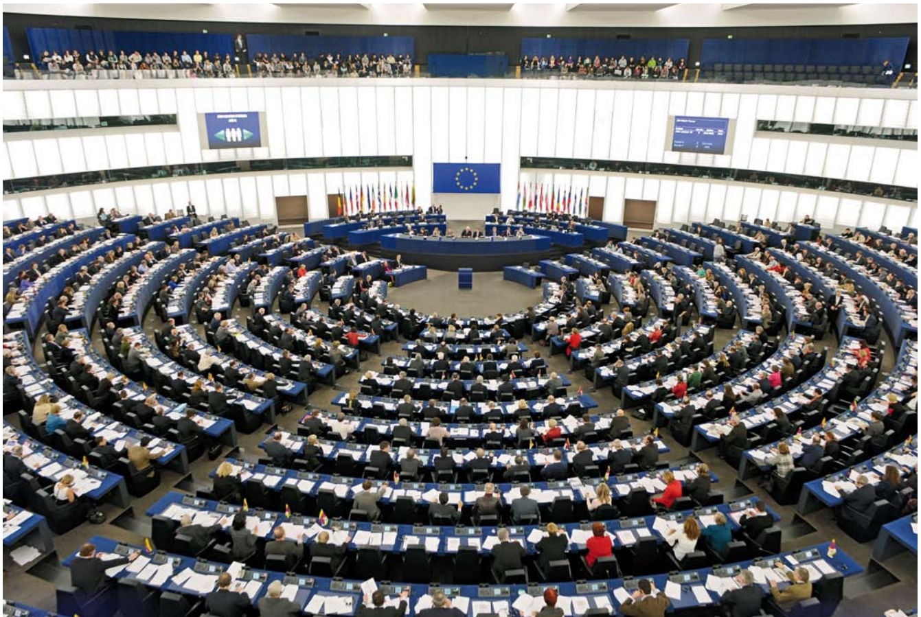
Plenarsitzung des Europäischen Parlaments in Straßburg.

http://www.europarl.de/ressource/static/files/parlament_arbeitsweise/guide_de.pdf